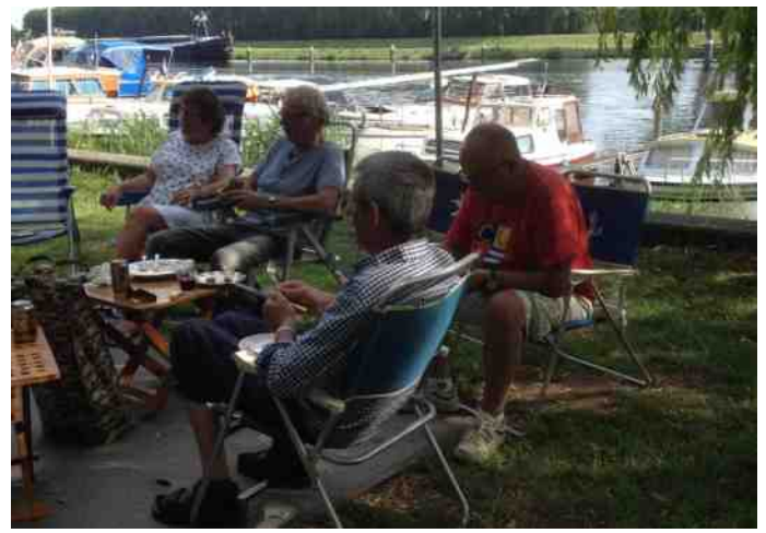
Wat was het gezellig!