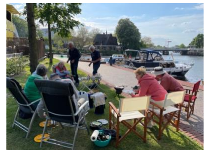
Als afsluiting een zeer geslaagde BBQ