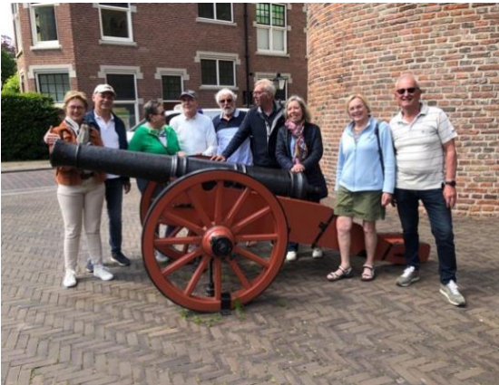
De groep bij een kanon uit de 80-jarige oorlog vlak bij de Sassenpoort