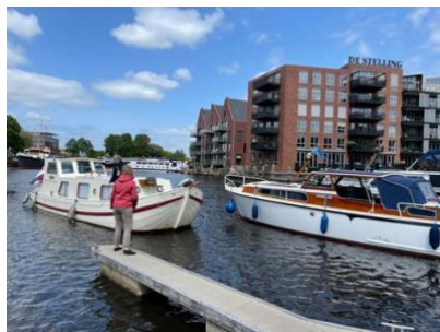
Een lijntje aanpakken bij aankomst in Zwolle