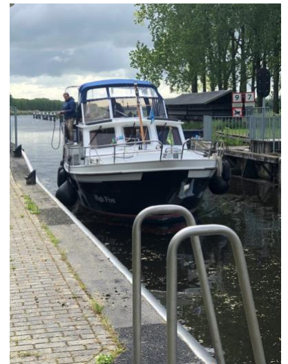
In Doesburg uitgezwaaid door de achterblijvers en de deelnemers die een dag later kwamen