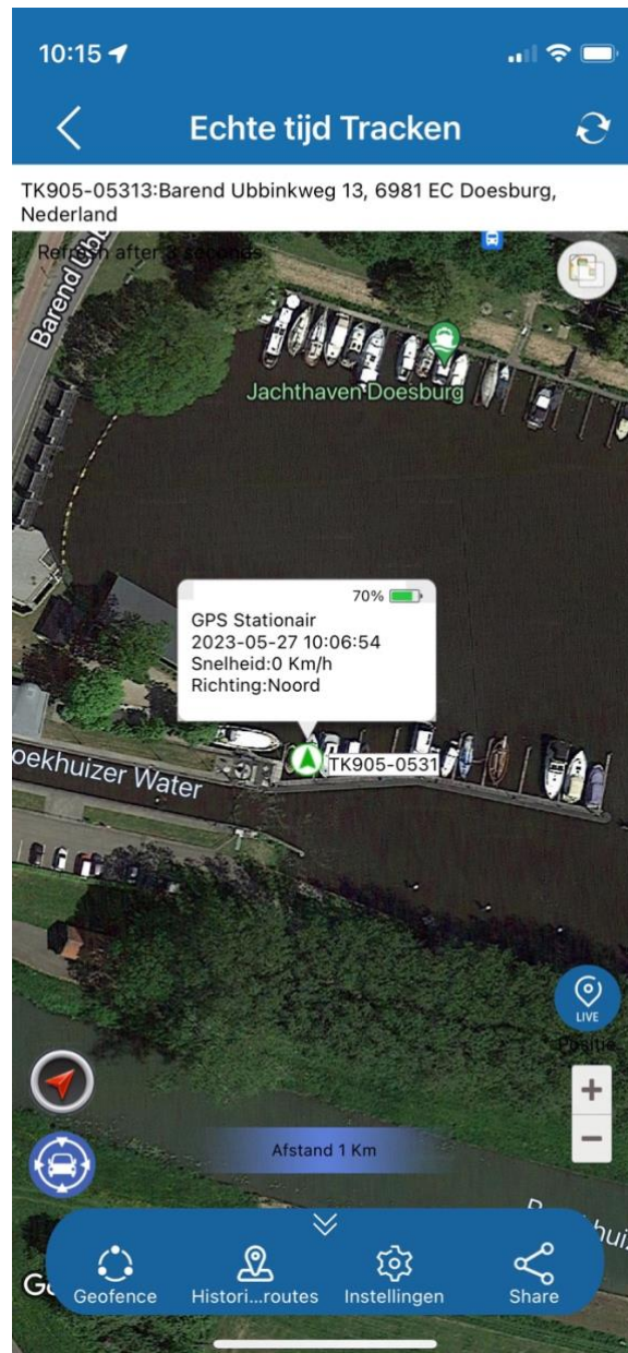
Locatie van de GPS, snelheid en accu niveau