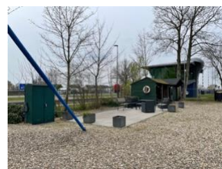
Locatie overkapping Zuid

Op de ALV afgelopen maart heeft het bestuur de opdracht gekregen om over te gaan tot het uitwerken van een plan voor een overkapping op Noord en idem met geïntegreerd havenkantoor op Zuid. Hiervoor is in april een 'Noord-Zuid overleg' bij elkaar geweest. De eerste ideeën zijn uitgewerkt en de eerste schetsen zijn gemaakt.