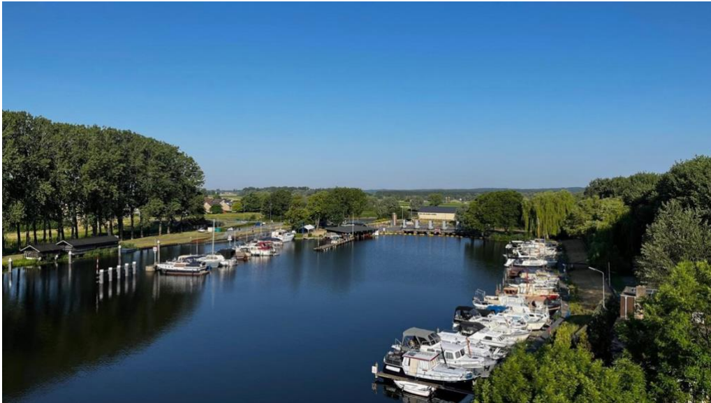
Blik op onze haven vanuit het nieuwe appartementencomplex Brugwachter

Dat is een wederzijdse keuze. Een keuze om samen met andere leden de schouders eronder te zetten om onze vereniging levend te houden en door te bouwen op wat onze voorgangers hebben gerealiseerd. Het is veel meer dan alleen het innemen en betalen van een ligplaats. Onze vereniging heeft een rijke historie van 85 jaar. Begonnen in een tijd vlak voor de tweede wereld oorlog.