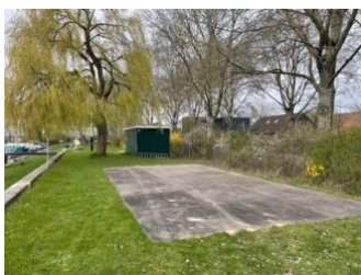
Locatie overkapping Noord

Op de ALV afgelopen maart heeft het bestuur de opdracht gekregen om over te gaan tot het uitwerken van een plan voor een overkapping op Noord en idem met geïntegreerd havenkantoor op Zuid. Hiervoor is in april een 'Noord-Zuid overleg' bij elkaar geweest. De eerste ideeën zijn uitgewerkt en de eerste schetsen zijn gemaakt.