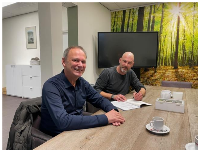
Ondertekening van de akte