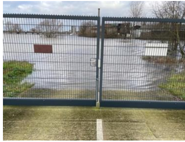
De helling met het hoge water rond de Kerst

Alle leden hebben een uitnodiging gekregen om de handen uit de mouwen te steken. Op zaterdagochtend is er inloop vanaf 8.30 uur zodat de taken verdeeld kunnen worden en we om 9.00 uur echt aan de slag kunnen. Er is veel tuin-, schoonmaak- en reparatiewerk op zowel Noord, Zuid als West. Denk er ook aan om zelf bijvoorbeeld snoeischaars, schoffels, harken, bezems, scheppen en/of schoonmaakartikelen mee te nemen. Dit is een mooie gelegenheid om te laten zien dat u de vereniging een warm hart toe draagt.