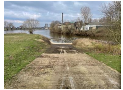
De helling nu, met veel achtergebleven slib en modder. Een flinke schoonmaakklus!