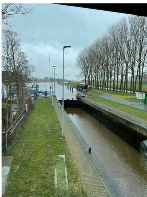
Uitzicht vanuit het sluisgebouw

Door het Waterschap Rijn IJssel waren we er op voorbereid dat de sluis vanwege het vervangen van de deuren en het verlagen van het benedenhoofd vanaf 16 september a.s. gedurende 10 weken zou zijn gestremd. Na overleg en het afwegen van alle belangen heeft het Waterschap besloten om dit werk 2 weken uit te stellen. Nu zal de sluis vanaf 30 september 2024 zijn gestremd. Dit geeft ons ook iets meer lucht.