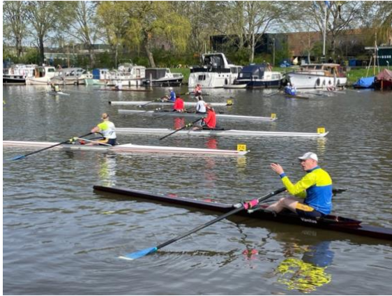
Voorbereiding op de start. Omdat de twee's harder gaan starten die eerst.