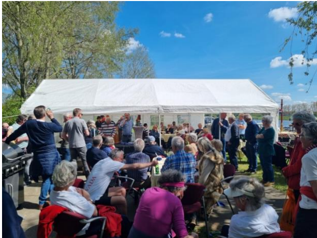
Opening vaarseizoen 2023

getalen naar Doesburg waar ons evenemententeam een lekkere lunch met mosterdsoep verzorgd. Dit levert elk jaar weer een mooie opbrengst voor onze verenigingskas op.