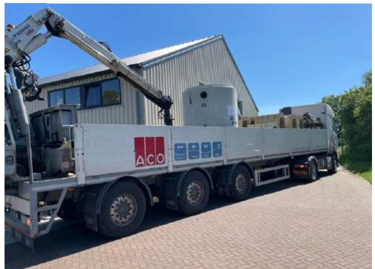
Kraan met lekke hydrauliek. De OBAS kon nog net getild worden en de wagen kon rechtstreeks terug naar de garage