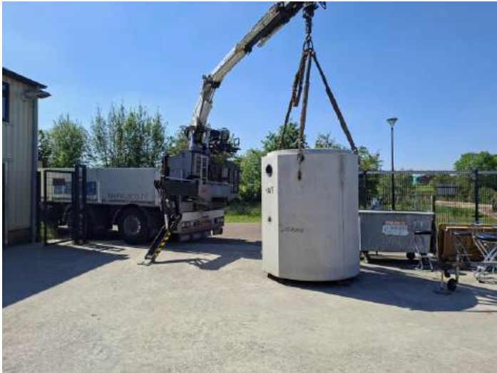
Levering van de nieuwe OBAS: 5400 kg en goed voor 2.000 liter. De wagen van Aalbers was te lang om op ons terrein te komen.