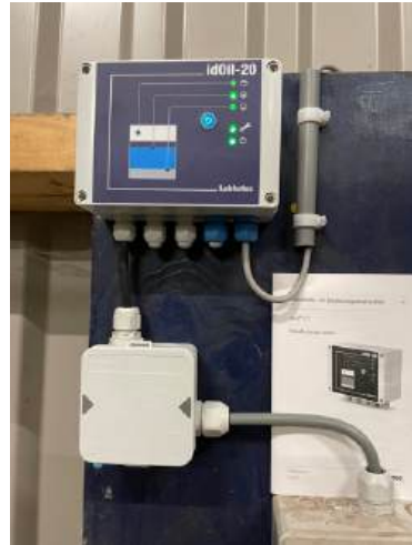
Ingebouwd alarmsysteem als te veel olie/benzine in de OBAS komt