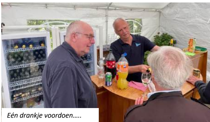
Eén drankje voordoen.....

Op dit moment in de tijd hebben we al weer een aantal evenementen achter de rug waaronder onze AHUM dag, waarbij een ieder heeft kunnen bijdragen aan het weer netjes maken van onze bezittingen, de Oude IJssel Race en de Mosterdsoeptocht. Ook de hellingdagen zijn weer achter de rug en over enige weken gaan de schepen die van de 6-weken regeling gebruik maken weer het water in.