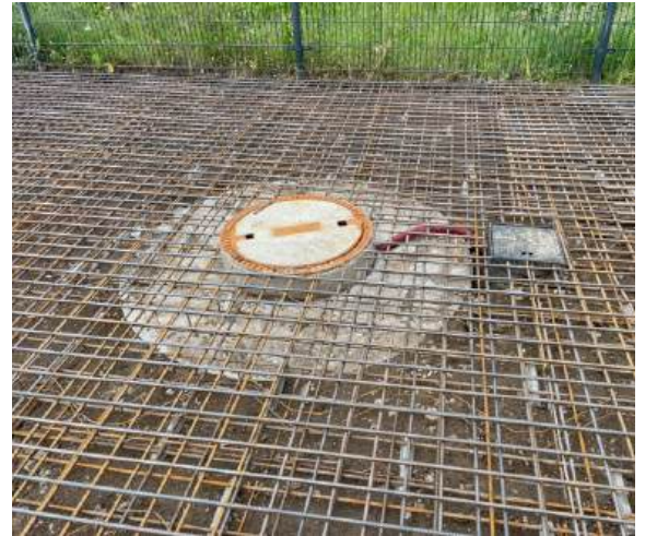
Ook al is het werk uitbesteed moet je zelf overal op letten: betongaas veel te hoog en liep door tot onder het hek