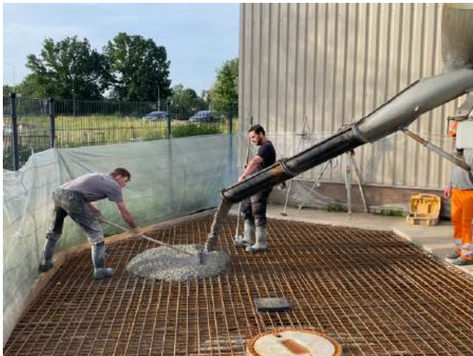
Storten van het beton, de kanten netjes met plastic afgedekt