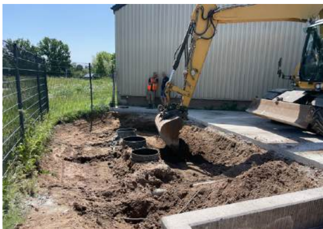
Uitgraven van de oude installatie