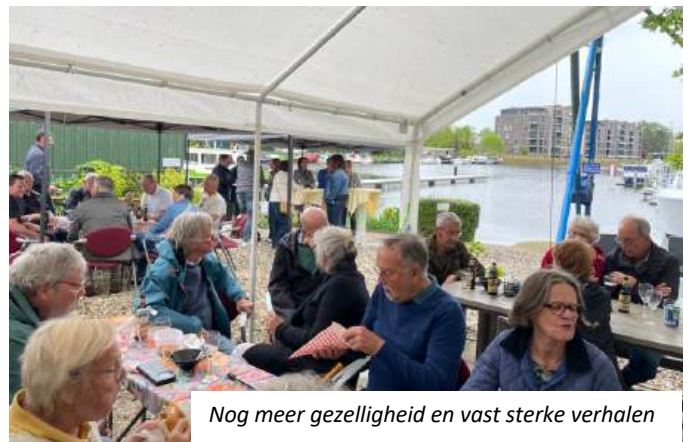
Nog meer gezelligheid en vast sterke verhalen