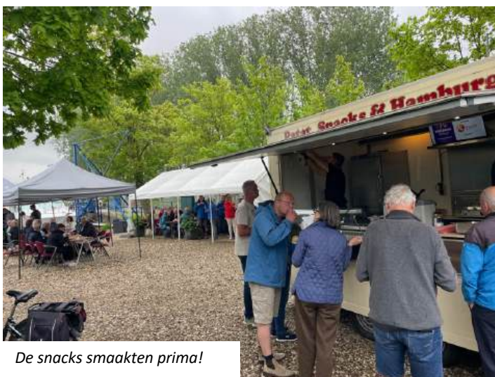
De snacks smaakten prima!

Ondanks de regenspatten werd het een gezellige middag. Deze keer kon iedereen zichzelf van een drankje voorzien en later op de middag was er een snackwagen met het nodige lekkers. Voor de verandering deze keer geen muntenverkoop maar een (grote....) bus voor een bijdrage waarvan de aanwezigen zelf mochten bepalen wat ze de middag in financiële zin waard vonden. Dit is goed bevallen en voor herhaling vatbaar