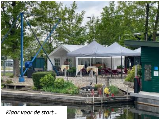
Klaar voor de start...

Op dit moment in de tijd hebben we al weer een aantal evenementen achter de rug waaronder onze AHUM dag, waarbij een ieder heeft kunnen bijdragen aan het weer netjes maken van onze bezittingen, de Oude IJssel Race en de Mosterdsoeptocht. Ook de hellingdagen zijn weer achter de rug en over enige weken gaan de schepen die van de 6-weken regeling gebruik maken weer het water in.