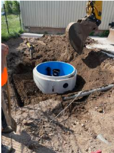
Nu weten we ook hoe de hwa, de elektra en waterleiding loopt