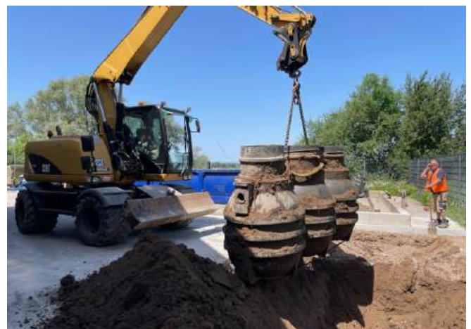
De drie vaten vormen één geheel