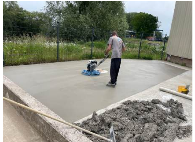
Het vlinderen van de vloer