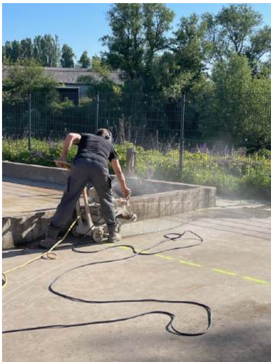
Zagen van het beton